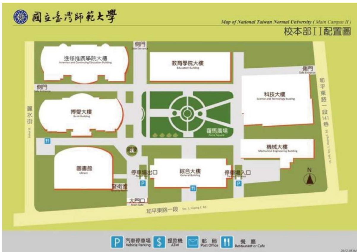
國立臺灣師範大學圖書館校區配置圖