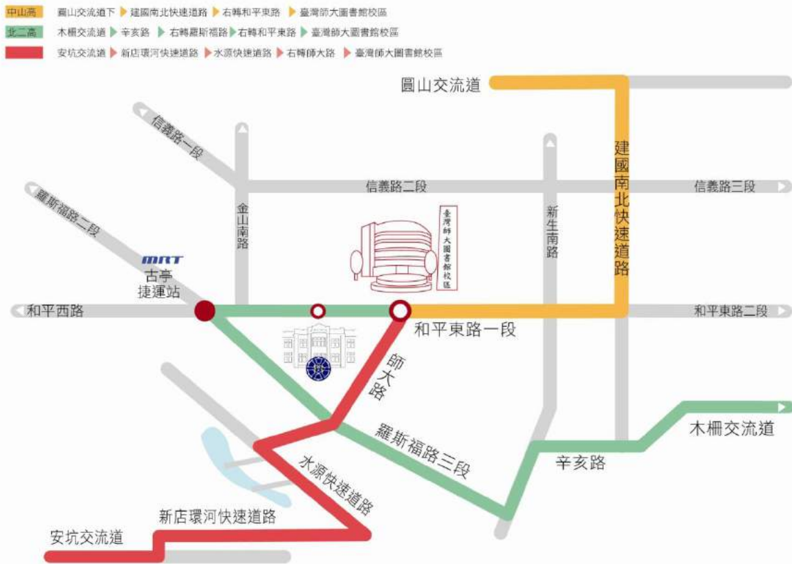
國立臺灣師範大學校園高速公路指標