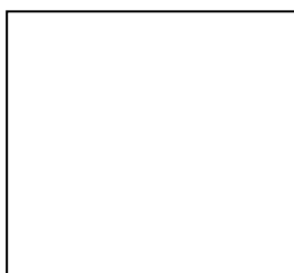
圖 1 XX 圖

表格標題必須為 12pt，標楷體，置於表格上方且置中，與前後段距離 0.5 列。表格編號請用阿拉伯數字依序編號，例如「表 1」而非「表一」。表格請盡可能排成同頁。