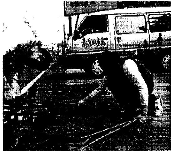
故事蒐錄行動列車下鄉錄製情景

部分偏鄉與未設置故事蒐錄站的地區，也設有 2 臺「故事行動列車」，以巡迴下鄉的方式，讓偏鄉民眾便於參與錄製。