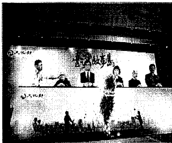
「國民記憶庫：臺灣故事島」啟動儀式

萬人的寫照之一，都代表了臺灣的一部分，還有很多臺灣人的深層記憶，臺灣人自己都並不認識。官方記事、學者書寫、史家研究固然都是史，但是國民口述的生命史是最真實的、最貼近個人的，也是最沒政黨色彩的、最沒被掩飾的。臺灣是個故事島，每個人都有自己的故事，這些隱逸、幽暗、漂流、光明、開闊與歡樂的記憶，深埋在每個人的內心深處，而這些生命點滴的拼圖總匯，就是國民記憶庫，就是真正的國史。