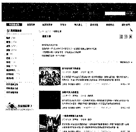
臺灣故事島網站—我要聽故事專區

國民記憶庫結合雲端科技，所有庶民記憶經過當事人同意，都會使用數位影音加以記錄，在專屬的「臺灣故事島」網站公開分享，民眾上網就可以看到、聽到別人的生命故事，目前網站上已累積 4,000 多則故事，並持續增加中，這些紀錄都將成為臺灣人最重要的資產，永遠保存，隨著故事資料的逐漸累積，讓國民記憶庫的素材成為涓涓清流，溫潤臺灣人的心靈。