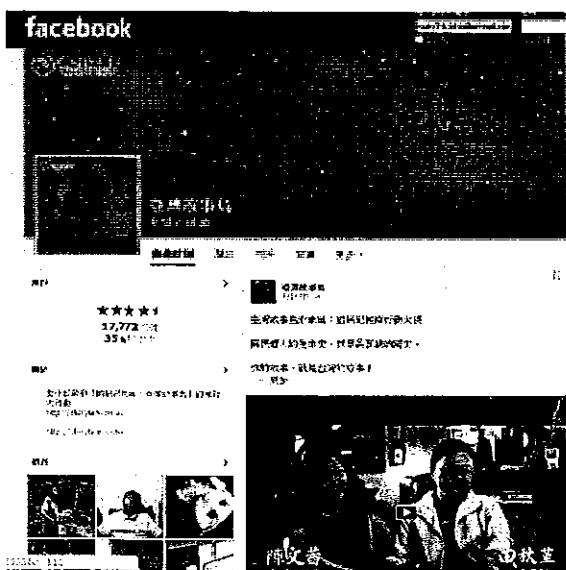
臺灣故事島臉書(Facebook)粉絲專頁

另外，同步設置有「臺灣故事島臉書(Facebook)粉絲專頁」，不定期上傳最新消息及精選故事，目前粉絲會員已達 2 萬 1,000 人，可自臉書搜尋「臺灣故事島」，按「讚」加入好友，讓庶民的溫暖感動您心。