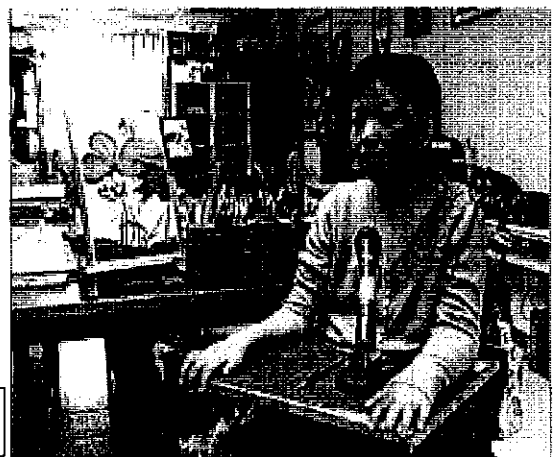
義工為身障者到府服務情景

0800-66-00-55 (錄-你-我)，專人服務時間週一至週五上午 8 時至下午 6 時，其餘時間皆提供語音留言，方便年長及行動不便預約各項服務。