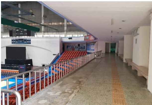
走道：設立廠商展位