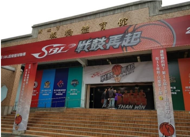
大門入口：廣宣包裝