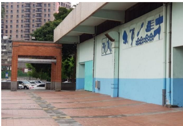
館外：設立廠商展位、宣傳、指示