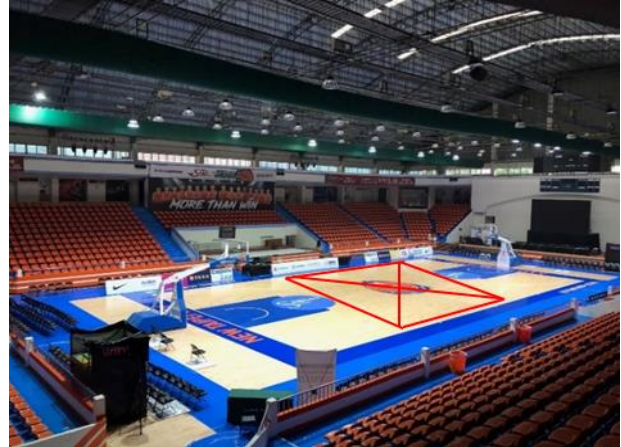
主舞臺1：設於場中央；周邊看板贊助商廣告