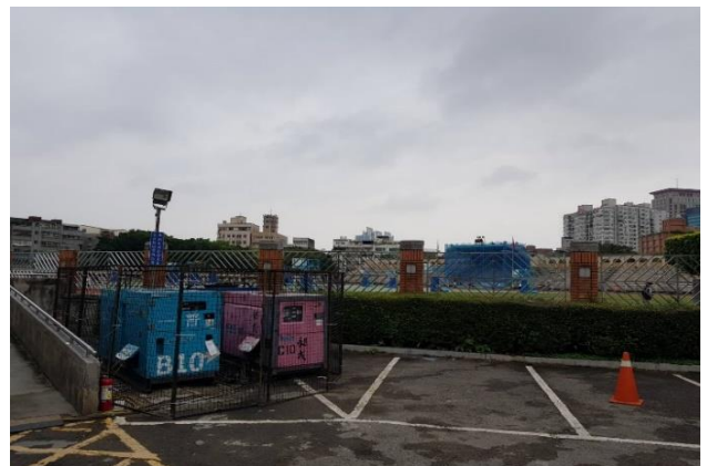
發電機租借：於場外，停車場旁